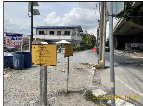
ภาพที่ 2.2-1 ป้ายแสดงตำแหน่งแนวท่อก๊าซ