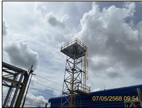
ภาพที่ 2.2-6 Stack Silencer